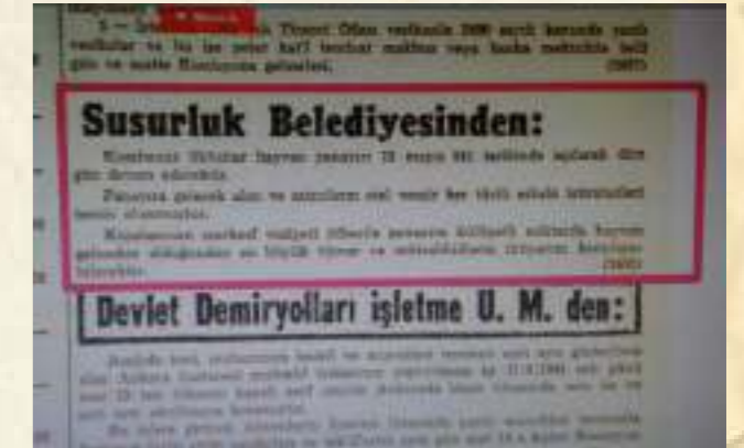
Resim 12: 1941 panayırı ile ilgili Susurluk Belediyesi'nin yurttta yayınlanan gazetelere verdiği ilan

Bilhare hayvan panayırına olan ilgi üzerine ve hayvan ticaretine katkı sağlaması amacıyla uzun yıllar devam etti. 1940'lı yıllarda panayırlara ilginin artması ve dışarıdan gelen müşteri sayısının fazlalığı nedeniyle belediyeler gelen müşterileri ve ziyaretçilerin 3-4 gün süren panayırlar müddetince konaklama ve ihtiyaçlarını temin açısından büyük katkılar sağladılar ve hatta ilanlarında bu konuya değindiler.