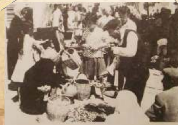
Resim 11: 1960-1965 'li yılları pazar yeri

Bilhare hayvan panayırına olan ilgi üzerine ve hayvan ticaretine katkı sağlaması amacıyla uzun yıllar devam etti. 1940'lı yıllarda panayırlara ilginin artması ve dışarıdan gelen müşteri sayısının fazlalığı nedeniyle belediyeler gelen müşterileri ve ziyaretçilerin 3-4 gün süren panayırlar müddetince konaklama ve ihtiyaçlarını temin açısından büyük katkılar sağladılar ve hatta ilanlarında bu konuya değindiler.