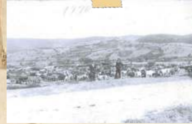
Resim 9: 1930 yılında düzenlenen hayvan panayırı

yıllarda, 1926'da ilçe oluşumuz ile gündeme gelmiş olup 1928'den itibaren HAYVAN PANAYIRLARI düzenlenmeye başlanmıştır.