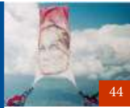
Türk Hava Kurumu