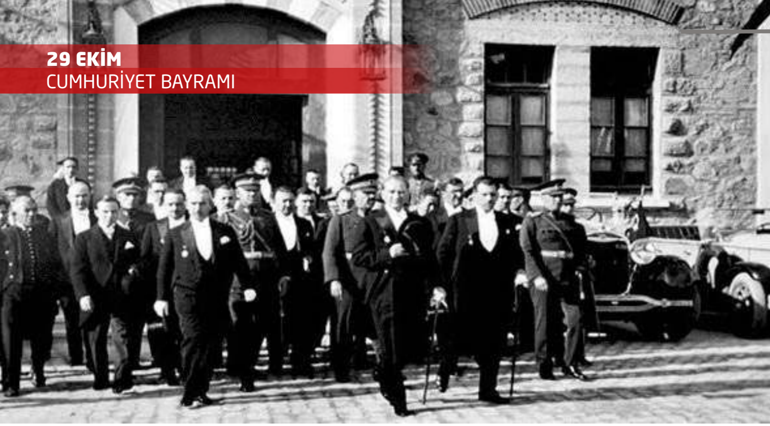
“YA İSTİKLAL YA ÖLÜM”

Bu yıl, 94. yıldönümü kutladığımız Türkiye Cumhuriyeti'nin kuruluşuna giden yolun başlangıcında milletimizin “kayıtsız şartsız, bağımsız yeni bir Türk Devleti” kurmak üzere “ya istiklâl ya ölüm” ilkesi ile başladığı Milli Mücadele ve Kurtuluş Savaşımız yer almaktadır. Bu süreç içinde Erzurum ve Sivas Kongrelerini takiben 23 Nisan 1920’de, millî iradeye dayanan Türkiye Büyük Millet Meclisi açılmış ve bütün dünyaya karşı, yayınladığı beyanname ile “egemenliğin kayıtsız şartsız Türk milletine ait olduğunu” ve “Büyük Millet Meclisi’nin üzerinde hiçbir makam bulunmadığını” ilân etmişti. Gerçi bu meclis ve bu meclisin içinden çıkan ‘Türkiye Büyük Millet Meclisi Hükümeti’, yapısı ve işleyişi yönünden, aslında ismi konmamış bir cumhuriyet yönetiminden farksızdı. Ama Millî Mücadele’nin ve Kurtuluş Savaşı’nın zaferle bitişini ve Lozan Antlaşması’yla bağımsızlığımızın bütün devletlerce onayını takiben, artık devlet yönetiminin daha açık biçimde isim alması gerekiyordu. İşte 29 Ekim 1923 günü yapılan Anayasa değişikliği ile bu husus da yerine getirildi ve bu yıl 94. yıldönümünü kutladığımız Cumhuriyet ilân edildi.