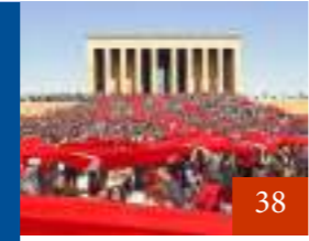
29 Ekim Cumhuriyet Bayramı