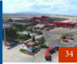
Assan Gıda San. Ve Tic. Anonim Şirketi