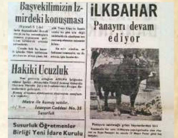
Resim 13: 1960 panayırı Susurluk Gazetesi ilanı

Panayırların büyük ilgi görmesi üzerine, hayvan panayırının yanı sıra hayvancılıkta kullanılan bazı araç gereçlerin (çan,hayvan bakım timar temizlik ve tarım alet ve malzemeleri) manifatura, yiyecek içecek, ev gereçlerinin de satıldığı tezgah, gelenlerin ve üreticilerin geceleri istirahat edebileceği, eğlenebileceği mekanlar ve eğlenceye yönelik yarışmalar, oyun ve atlı karınca gibi çocuklarında ilgisini çekecek eğlence panayırlarında bunlarla beraber devreye girdi. Uzun seneler panayırlar ilçemizin vazgeçilmez oldu. Daha sonra panayırlar ilkbahar ve sonbahar panayırları olarak yerini aldı ve yılda 2 sefer yapılmaya başlandı.