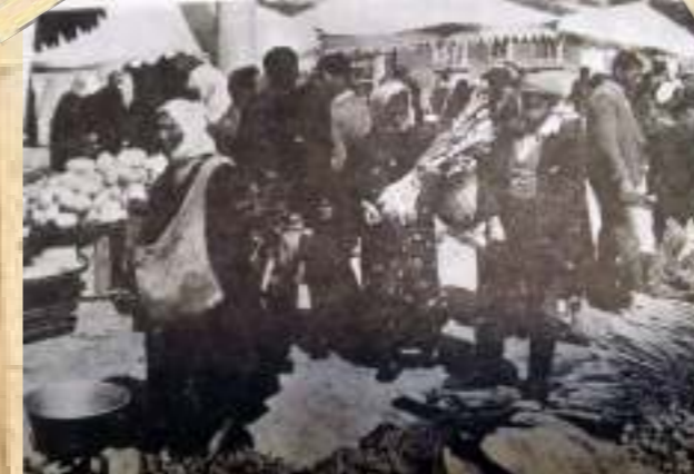
Resim 10: 1960-1965 'li yılları pazar yeri

-Hayvan panayırı SUSURLUK merkez ilkbaharda: 15-18 Mayıs tarihlerinde -GÖBEL nahiyesinde ilkbaharda: 29-30 Mayıs tarihlerinde -ÖMERKÖY nahiyesinde: 07-14 Ağustos tarihinde -KARAPÜRÇEK nahiyesinde: 15-17 Ağustos tarihinde yapılmakta idi.