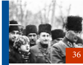
30 Ağustos Zafer Bayramı